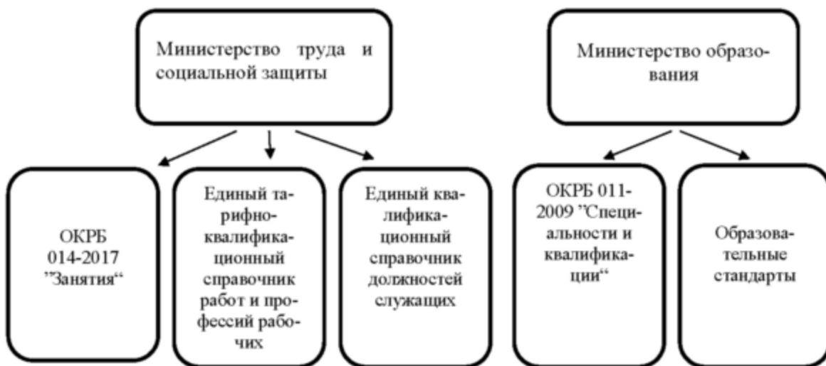
Рисунок 1. Действующая НСК

В условиях ускоренного технологического развития все большее значение приобретает получение знаний, умений и навыков на протяжении всего периода трудовой активности человека как непосредственно в учреждениях образования, так и вне учреждений образования. При этом в Республике Беларусь отсутствует система признания квалификации, достигнутой работником вне учреждения образования.