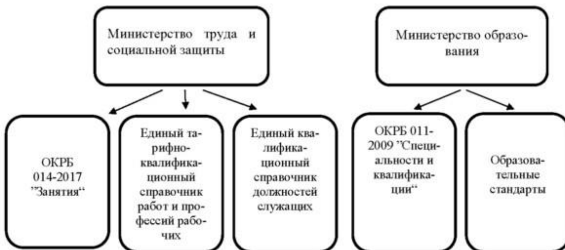
Рисунок 1. Действующая НСК

В условиях ускоренного технологического развития все большее значение приобретает получение знаний, умений и навыков на протяжении всего периода трудовой активности человека как непосредственно в учреждениях образования, так и вне учреждений образования. При этом в Республике Беларусь отсутствует система признания квалификации, достигнутой работником вне учреждения образования.